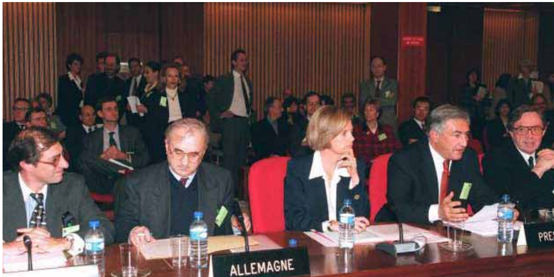
Unterzeichnung des OECD-Abkommens gegen Korruption*: „Wer jetzt besticht, wird vom Markt gefegt“

sche Unternehmen bis hin zur Gefährdung von Arbeitsplätzen benachteiligen“.