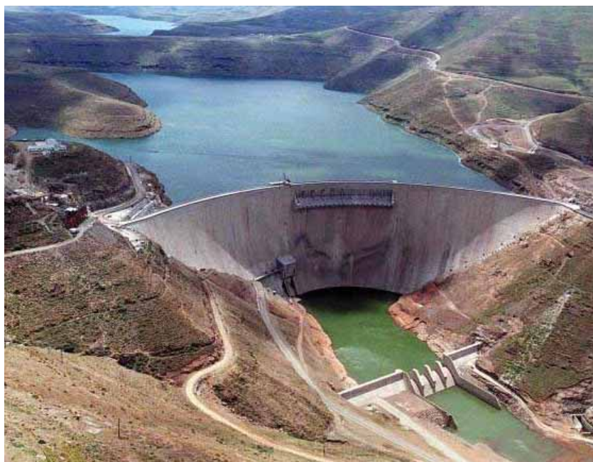
Staudamm in Lesotho: Zwei Millionen Dollar für den Projektleiter

Das ungewöhnliche Internet-Angebot ist Teil einer Kampagne, mit der die US-Re-