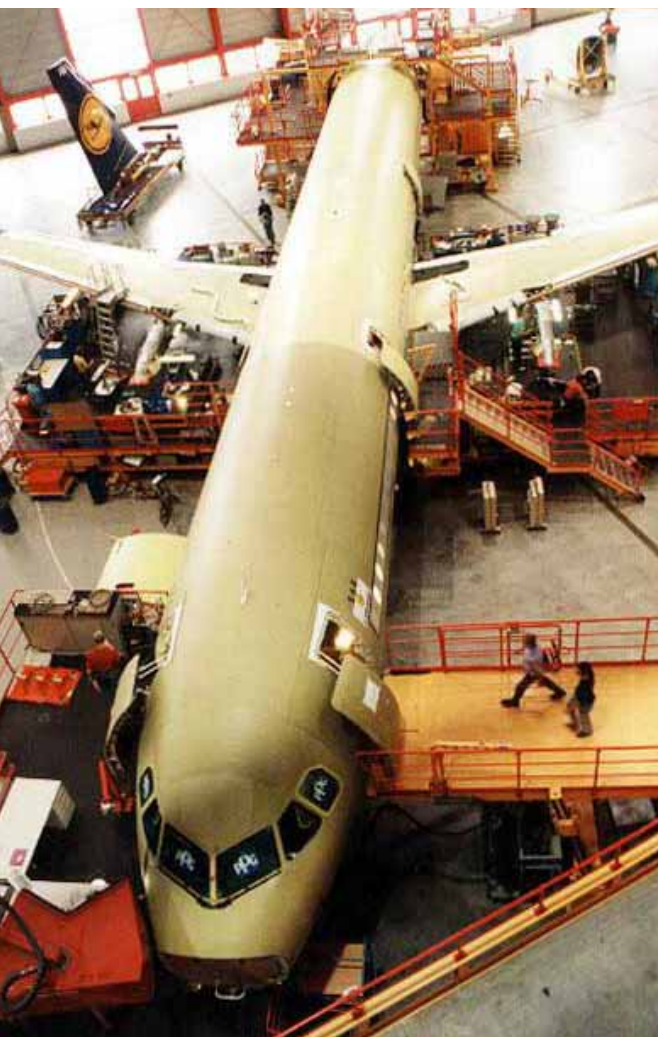
Airbus-Produktion*: Zocken um große Aufträge

Mit einem neuen Abkommen, das Bestechung im Ausland unter Strafe stellt, haben die Industrieländer einen globalen Feldzug gegen die Korruption begonnen. In deutschen Konzernzentralen herrscht Alarmstimmung.